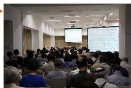
第11回南多摩病院公開講座

（注意）第11回はおかげさまで大好評・会場は満員でした。定員に達しますと締切日前に受付を終了する場合がございますので、申込はお早めをお願いいたします。