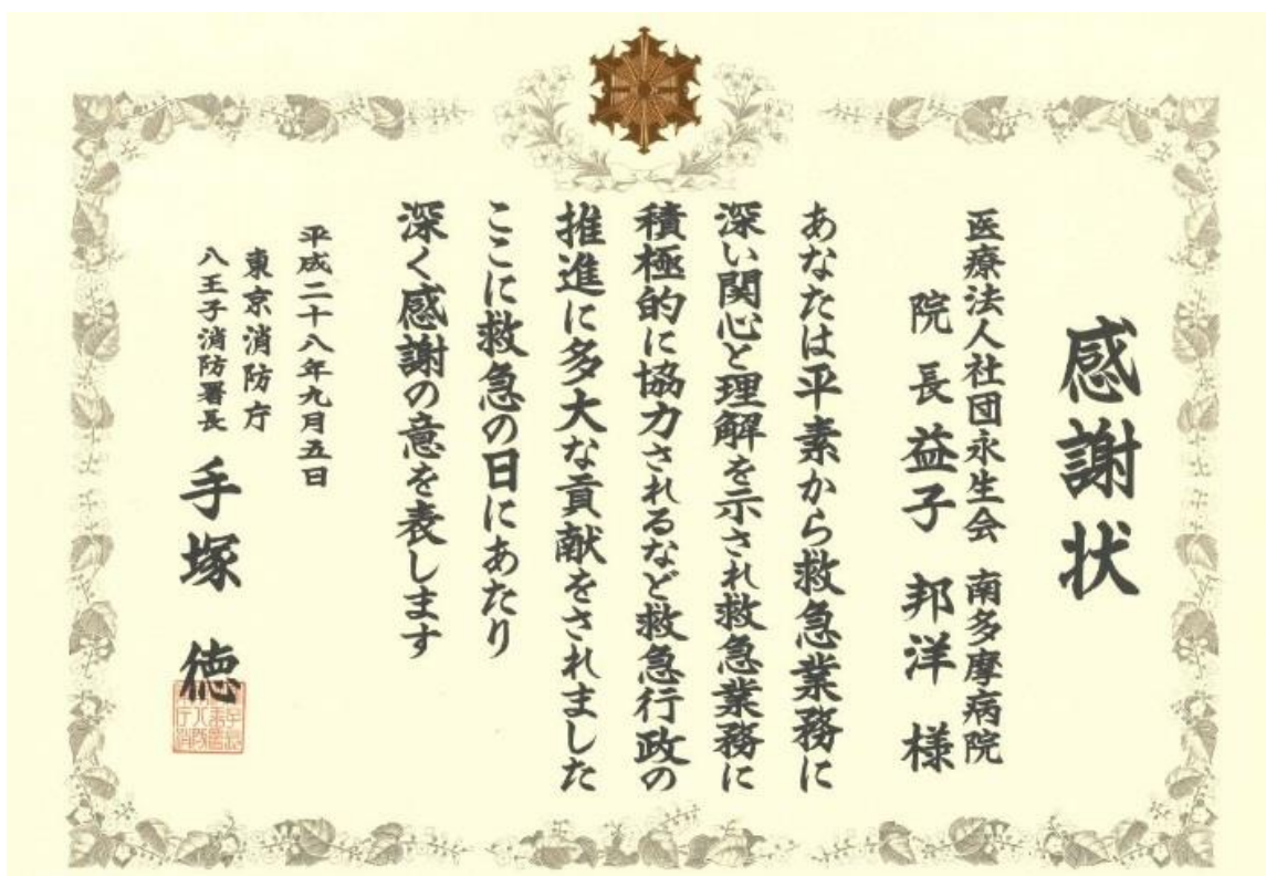
八王子消防署長より頂いた感謝状