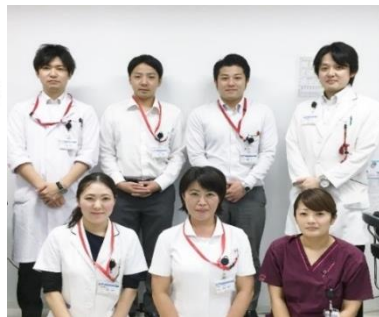
南多摩病院 退院支援部門