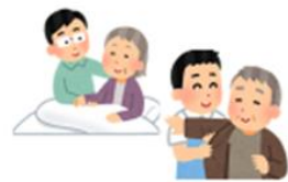
▽介護保険が未申請で必要なサービスを受ける準備ができていない状況