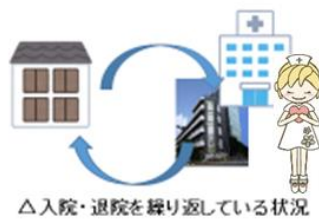
△入院・退院を繰り返している状況