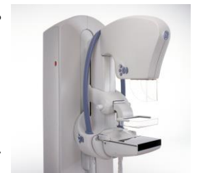
【当院導入装置】 デジタルマンモグラフィセグラー DS デビステイ

女性の11人に1人が「乳がん」になる時代です。マンモグラフィーは小さな病変、特に石灰化の抽出に優れた検査です。早期発見・早期治療で90%以上が治癒するがんですので、病気が見つかることを恐れず、定期的に検査を受けて、自分の体の事を知りましょう。