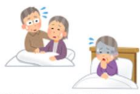
△退院後に独居・家族と同居であっても必要な介護が十分に提供できない状況