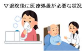
▽退院後に医療処置が必要な状況